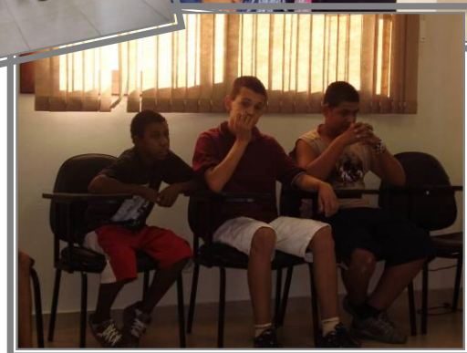
Três adolescentes do grupo 3 do Projecto Despertar

algumas actividades eram muito infantis e que tinham pouco a ver com eles, com as suas necessidades. Foi aí que a irmã Virgínia propôs que se pudesse trabalhar juntando o grupo 3 do Projecto Despertar e o Projecto 2 em actividades mais direccionadas para as questões da adolescência. Quando ela me convidou a colaborar neste novo projecto fiquei muito contente e aceitei sem pensar duas vezes. São adolescentes que já viveram e viram coisas incríveis, com muitas questões familiares por resolver, envolvidos em muitos tipos de violência e que têm muito poucos espaços de reflexão e de partilha. É um projecto que ainda está muito no início mas que já se consegue ver alguns frutos. No próximo relatório terei certamente novidades deste projecto para vos contar.